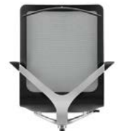
_1 Kleiderbügel Cintre de dossier