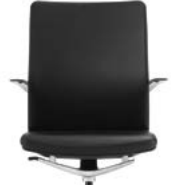
_4 Rücken Polster, Sitz Polster Dossier rembourré, assise rembourrée