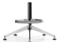
_8 Fünfsternfuß mit Fussbügel, Alu poliert, Rollen | Gleiter Piétement 5 branches avec repose-pieds, alu poli, roulettes | glisseurs