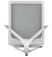
_2 Sitzschale hellgrau Coque de siège gris clair