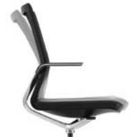
_1 Neigemechanik Mécanisme d'inclinaison