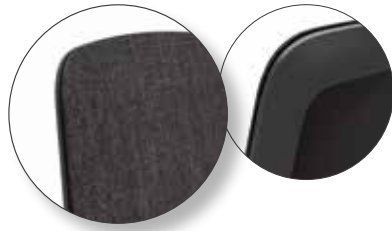
schwarzer Rahmen mit Polsterauflage