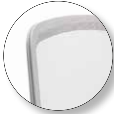
weißer Rahmen mit weißem Netzrücken