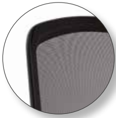
schwarzer Rahmen mit schwarzem Netzrücken