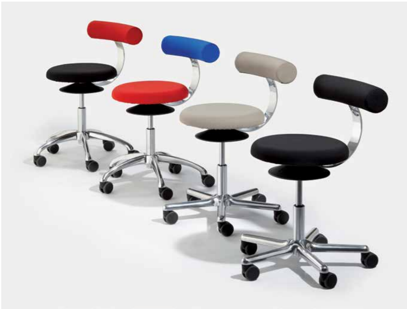
AOGO A und AOGO E