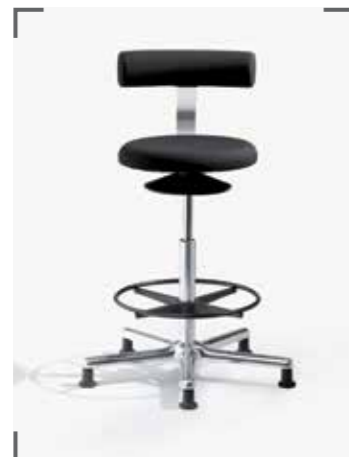
AOGO XL E