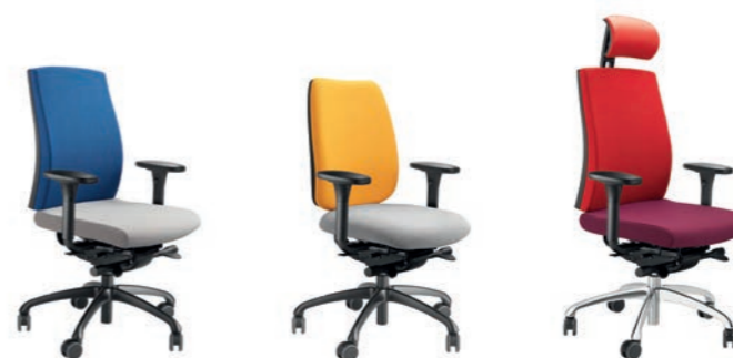
FIGO FG 19

BÜRODREHSTÜHLE / OFFICE SWIVEL CHAIRS / SIÈGES DE BUREAU