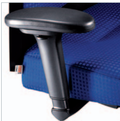
3D-Armlehnen AL 10 mit Soft-Touch-Pad, höhen-, tiefen- und breiteneinstellbar, Halterung PA Schwarz. 3D-Armleuningen AL 10 met Soft Touch Pad, hoogte-, diepte- en breedte instelbaar, houder PA zwart.