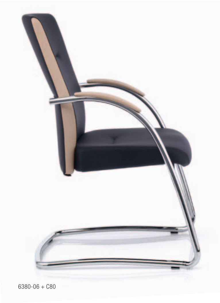
6380-06 + C80