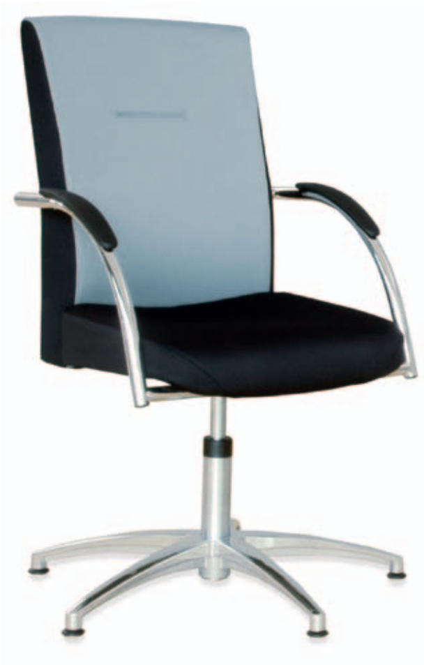
6380-06 + 90