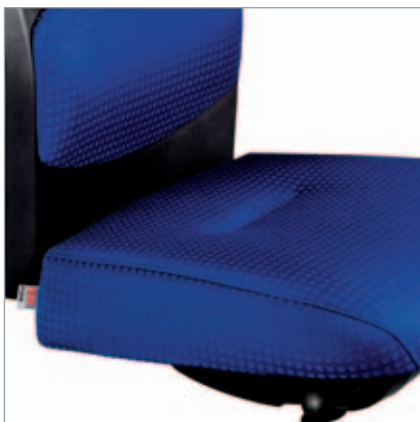
Taschenfederkern-Clipsitz (TFK) mit Seitenprofil. Pocketvering-clip-kussen (TFK) met zijprofiel.