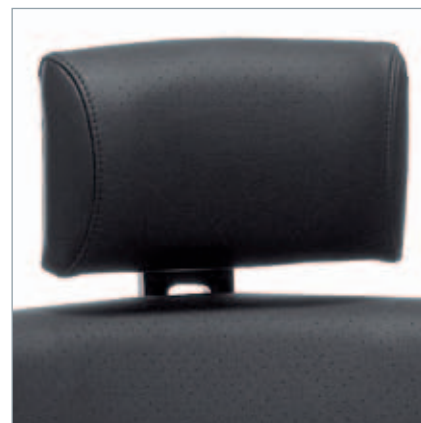
Kopfstütze Leder. Hoofdsteen leer bekleed