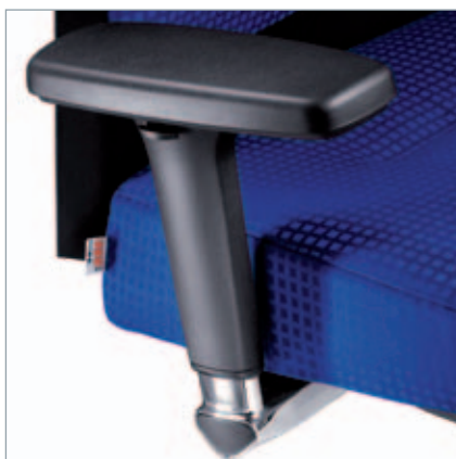
MF-Armlehnen AL 30 mit Deluxe-Pad, schwenkbar, höhen-, tiefen- und breiteneinstellbar, Halterung verchromt. MF-Armleuningen AL 30 met luxe pad, zwenkbaar, hoogte-, diepte- en breedte instelbaar, houder verchromd.