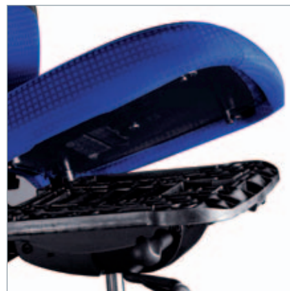
Werkzeugfreier Wechsel durch Polster-Clip-System. Zonder gereedschappen te verwisselen, door het Polster-Clip-Systeem.