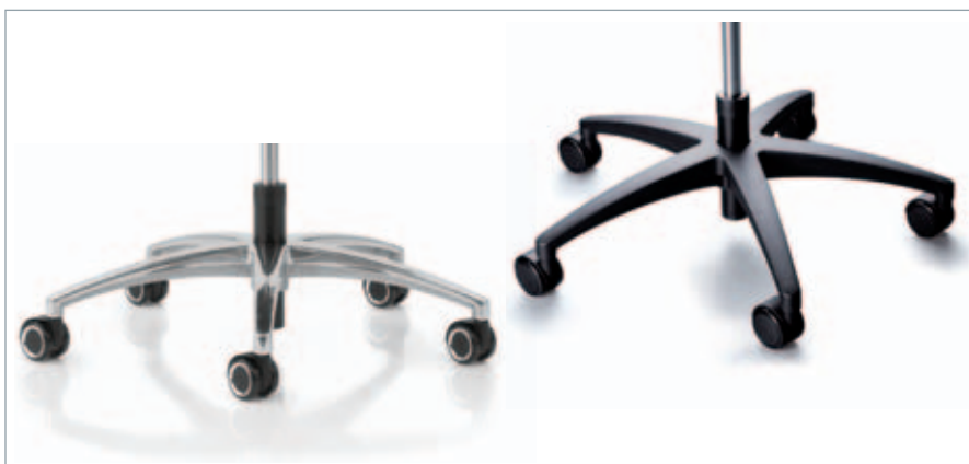
Fußkreuze wahlweise in Alu poliert oder glasfaserverstärktem Polyamid. Universalrollen mit Chromapplikation oder Standardrollen hart oder weich mit Abdeckung. Voetenkruis is verkrijgbaar in aluminium gepolijst of in glasvezel versterkt polyamide. Standaard uitgevoerd met harde of zachte afgedekte wielen, of universele wielen met chroom applicatie.