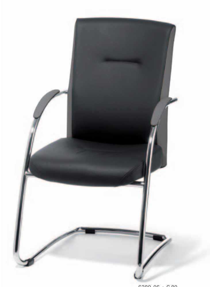
6380-06 + C 80