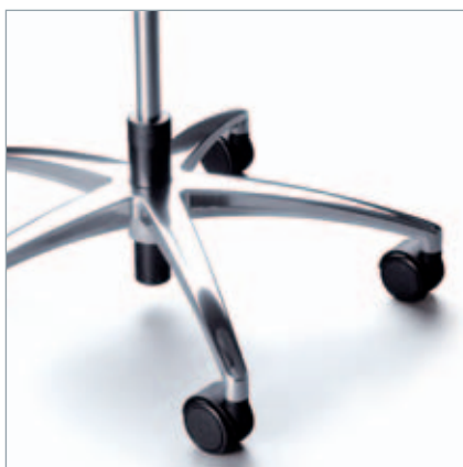
Pneumatische Sitzeinfederung (PSE) zur Entlastung der Bandscheiben beim Hinsetzen. Pneumatische zitdiepte vering (PSE) ter ontlasting van de rug, bij het gaan zitten.