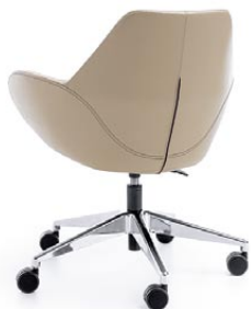
FAN 10E CHROME