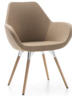
FAN 10HW WOOD