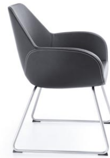
FAN 10V SATINE