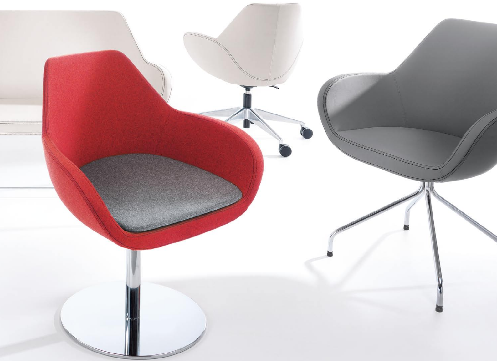
FAN 10R CHROME + cushion