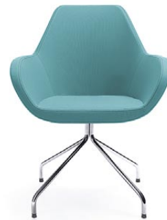
FAN 10H CHROME