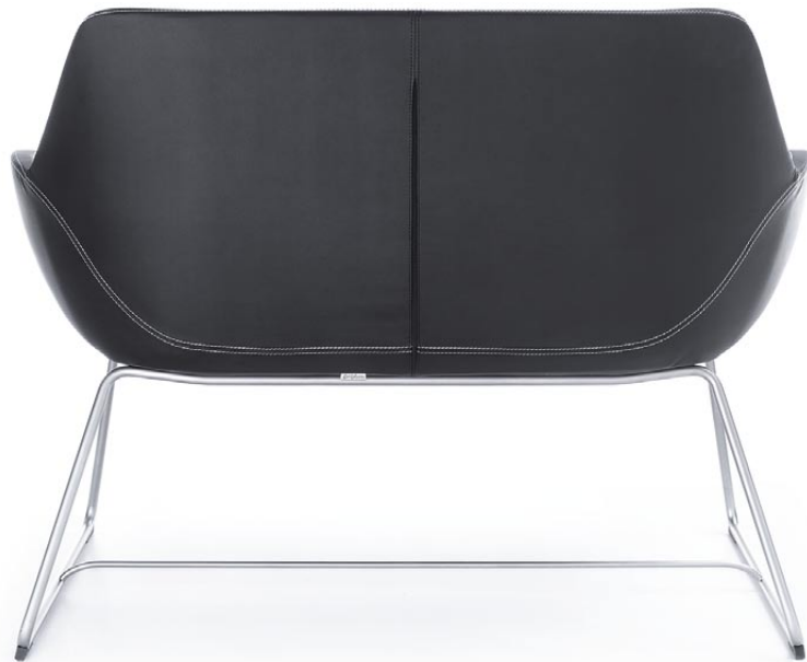
FAN 20V SATINE