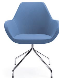
FAN 10HS CHROME